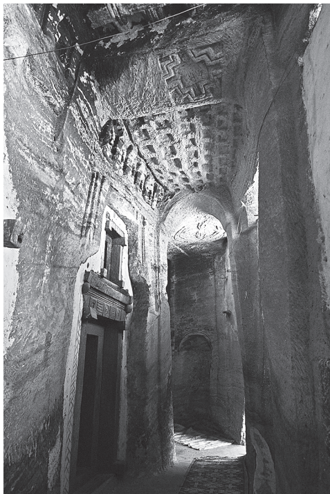
Ил. 4. Медхане Алем в Ади Кешо. Нартекс, вид на юг. Фото С. Клюева, 2014 г.