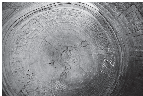
Ил. 9. Келья Абуны Абрехамы в Дебре Цион, Тыграй. Купол. Фото С. Ключева, 2014 г.

Среди множества схожих элементов декора кельи Абуны Абрехамы и церкви Медхане Алем в Ади Кешо отдельно следует выделить такие как: ромбовидные кессоны (в Медхане Алем они расположены в центральной ячейке свода