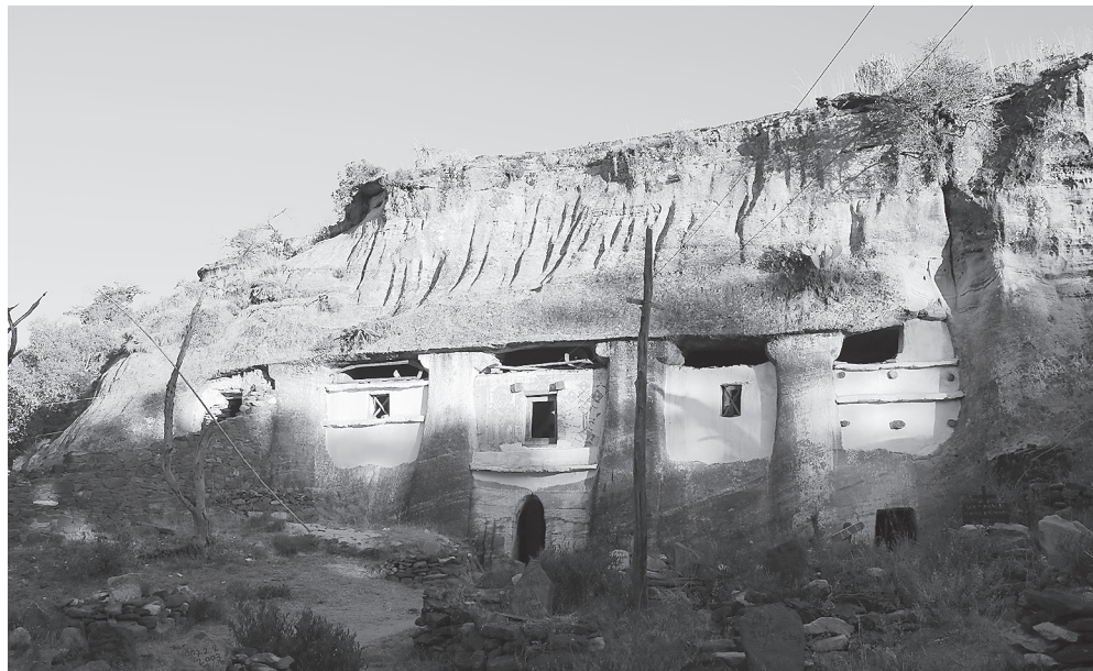
Ил. 2. Медхане Алем в Ади Кешо, Тиграй. Фасад храма. Фото Л. Масиеля Санчеса, 2015

в Ади Кешо представляет собой некоторую промежуточную стадию между традиционными базиликами и базиликами «открытого типа».