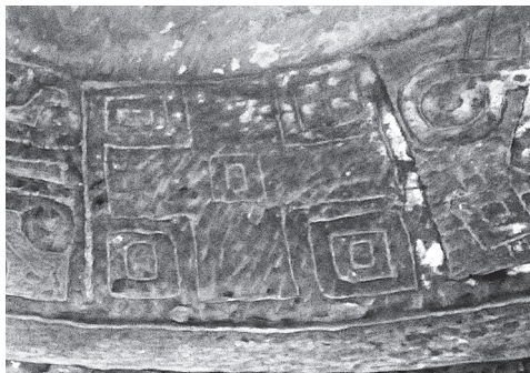
Ил. 10. Келья Абуны Абрехама в Дебре Цион, Тиграй. Деталь резного декора. Фото С. Клюева, 2014 г.

расположение, можно предположить, что она была создана единовременно с храмом.