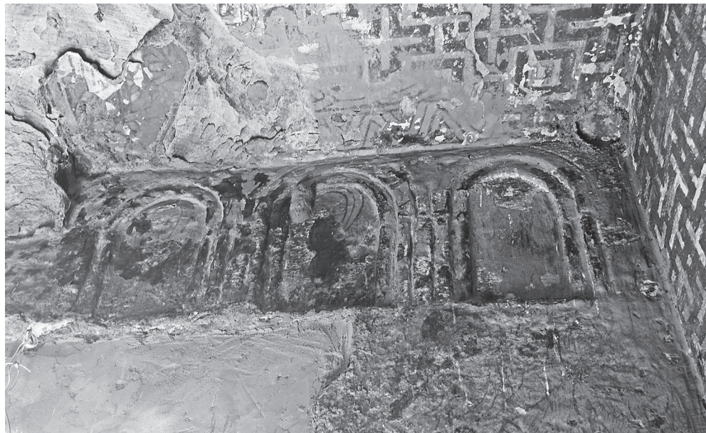
Ил. 8. Укро Черкос, Тыграй. Ниши с изображениями святых. Фото С. Ключева, 2014 г.

нефе. Например, в Георгис Дебре Маар ( Encyclopaedia Aethiopica 2005: 29–31). Ниши в стенах церкви в Ади Кешо неглубоки, без дополнительных элементов декора, которым отличаются ниши в Йесус Гибджет и Мариам Дебре Цион.