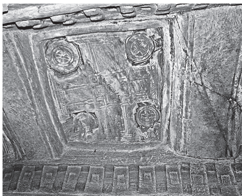
Ил. 5. Медхане Алем в Ади Кешо. Центральная ячейка свода наоса. Фото С. Клюева, 2014 г.

смещение, придающее композиции некоторый динамизм (ил. 4).