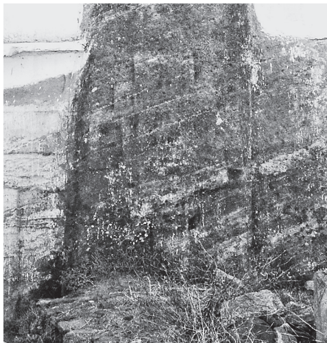
Ил. 7. Медхане Алем в Ади Кешо. Рельефный крест на столбе фасада, к югу от центрального входа в храм.

известно как в достаточно ранних храмах, например, в Дебре Селам X в. (Lepage, Mercier 2005: 94–101), так и более поздних, таких как Дебре Маар (начала XV в.) (Encyclopaedia Aethiopica 2005: 29–31).