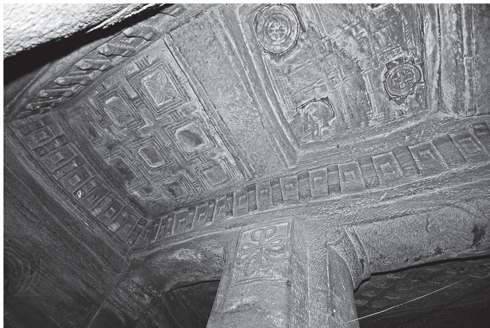
Ил. 6. Медхане Алем в Ади Кешо. Своды центрального нефа. Резной крест на северо-западном столбе. Фото С. Клюева, 2014 г.

В поздних храмах символика креста сохраняется, но его образ лишается как своего особого расположения в пространстве церкви (в центральном нефе, средокрестии), так и элементов, связанных с имитацией балочной конструкции консолей (Gerster 1970: 134).