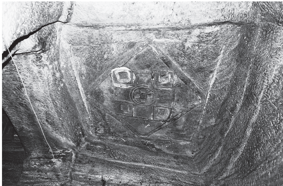
Ил. 3. Медхане Алем в Ади Кешо. Рельеф северо-западной ячейки свода наоса, имитирующий перекрытие по системе вписанных квадратов. Фото С. Ключева, 2014 г.

Ромбы, вырезанные на сводах северо- и юго-западной ячеек наоса, дополнены геометрическими элементами и христианскими символами (Gerster 1970: 128–129). В центральный квадрат вписан равноконечный крест с окружностью по центру, в которую в свою очередь помещен равноконечный крест или розетка. Рукава большого креста образуют акцентированные незначительным углублением кессоны (ил. 3).