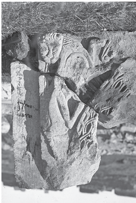
Ил. 5. Ани. Церковь Бахтагека. Фрагмент аркатуры.