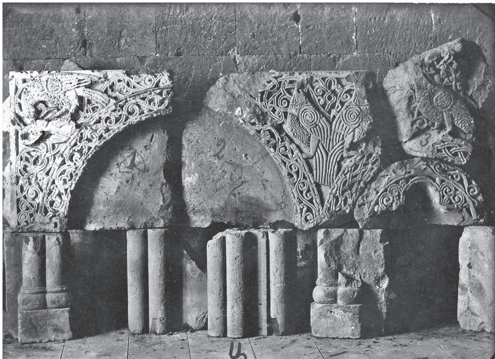
Ил. 3. Ани. Церковь Бахтагека. Фрагмент аркатуры.

зан почти плоскостно. Занимательно то, как его уши выходят за пределы растительного фона — на тонкую ленту рамы, огибающую под прямым углом всю композицию. Без сомнения, камень с этим сюжетом располагался в начальном звене аркатуры.