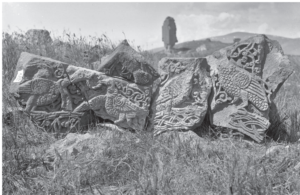
Ил. 7. Ани. Церковь Бахтагека. Фрагмент аркатуры. Отпечаток негатива из личного архива Н.Я. Марра. Фотоотдел Научного архива ИИМК РАН: Ф. 23. Нег. III 45

та, осуществленного другой артелью или под влиянием стиля других памятников.