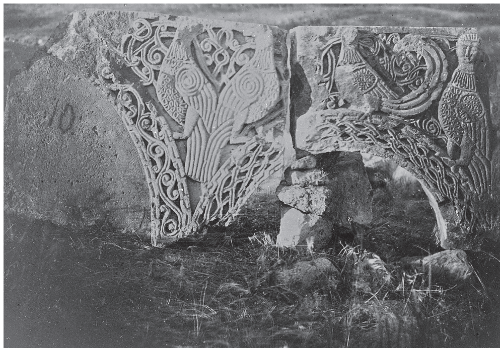
Ил. 4. Ани. Церковь Бахтагека. Фрагмент аркатуры.

кая полоса, как у рамы рельефа с орлом и зайцем. Возможно, что этот сюжет замыкал арочный ряд.