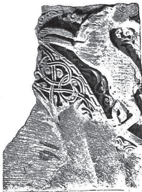
Ил. 8. Ани. Церковь Бахтагека. Фрагмент аркатуры (Сычев 1912: Табл. II)

Сама идея украшения фасадов аркатурой с резьбой, переходящей в антраль, в архитектуре Ани XII–XIII вв. нашла свое воплощение в целой группе храмов, которая в научном обороте получила название «церкви “живописного стиля”». В нее входят церкви Внутренней крепости (Ахчкаберда), Тиграна Оненца, Девичьего монастыря (Кусанац) и исследуемая церковь Бахтагека. В каждой постройке из этой группы общая идея внешнего декора нашла свое уникальное решение, особенно с точки зрения стиля. На это, безусловно, повлияли многие факторы, как, например, статус заказчика, избранный архитектурный тип, обзорность памятника и другие. Однако при внимательном рассмотрении обнаруживаются некоторые переключки или намеренное подражание одной церкви