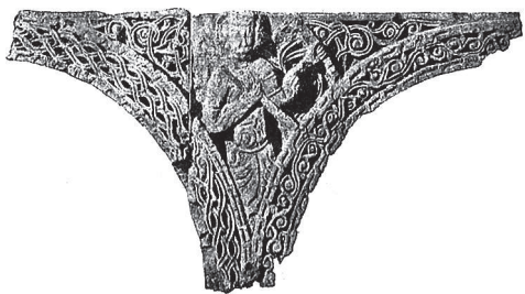
Ил. 6. Ани. Церковь Бахтагека. Фрагмент аркатуры (Марр 1894)

Такой же орнамент покрывал арочку над нишей.